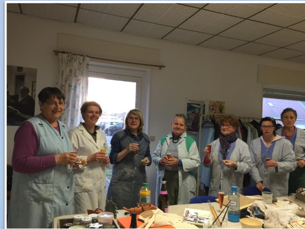
Loisir et Créativité